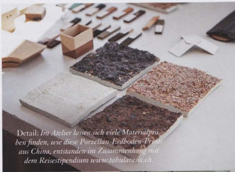
Detail: Im Atelier lassen sich viele Materialproben finden, wie diese Porzellan-Erdboden-Prints aus China, entstanden im Zusammenhang mit dem Reisestipendium www.tabularasia.ch .

Interview: Carina Iten