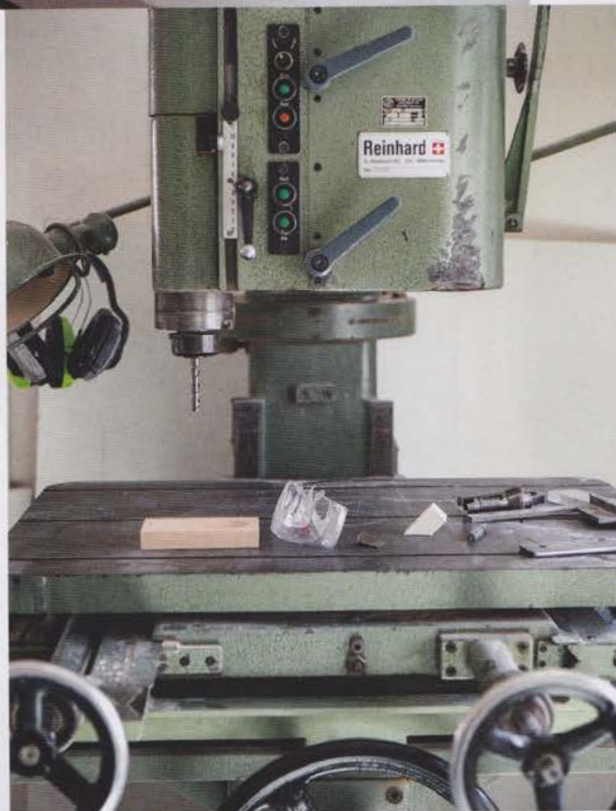
Werkstatt: Die meisten Produkte entstehen direkt hier – vom Prototyp bis zur Fertigstellung.